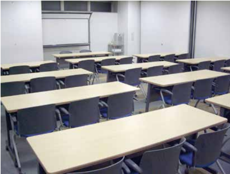
間仕切り収納で、30～37人を収容可能↑